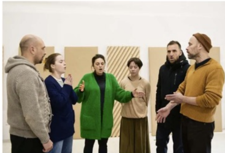
Trois hommes, trois femmes, composent la polyphonie. Les répétitions ont eu lieu en début de semaine et donnent lieu à quatre représentations en Creuse.

Le spectacle Chants de la guerre et du ciel tisse un lien artistique original entre la Creuse et l'Ukraine. La rencontre entre chants traditionnels est aussi une forme de solidarité internationale.